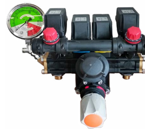
Comando elettrico a 2 vie reg. pressione elettrica