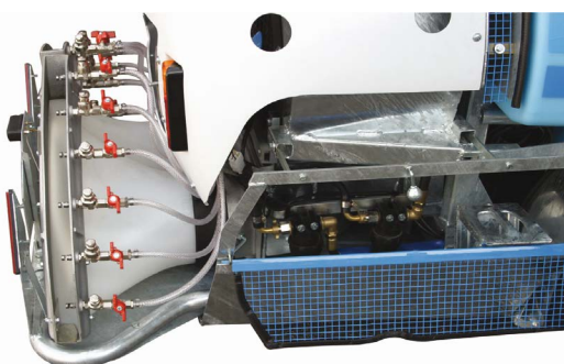
Filtro di mandata