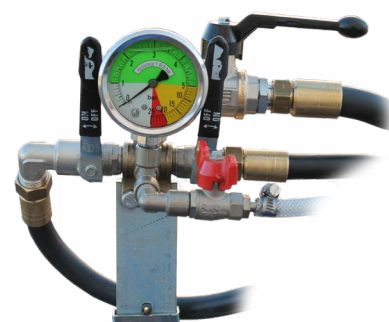
Comando manuale a distanza