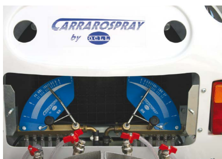
Sistema di calibrazione