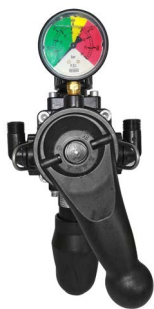
Comando manuale a distanza monoleva