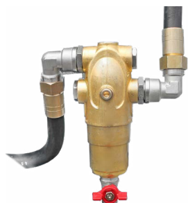
Filtro di mandata in ottone