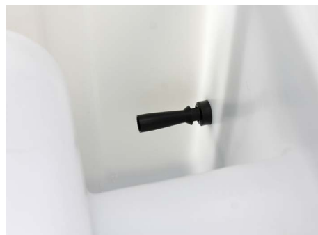
Agitatore idraulico di serie