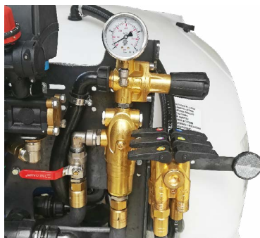
Kit alta concentrazione